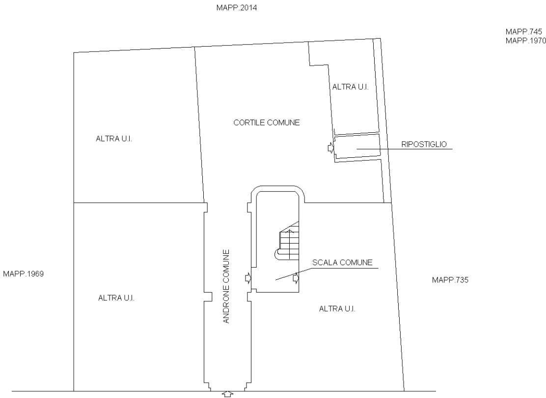
PIANTA PIANO TERRA H=2.15 m