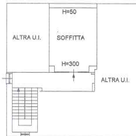
PIANO TERZO SOTTOTETTO